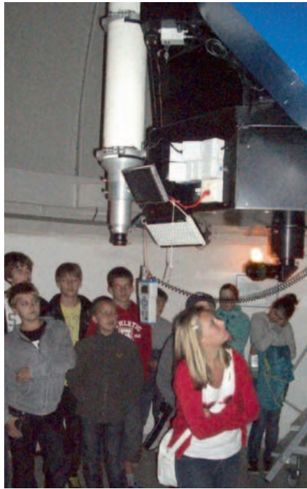
Es war spannend und etwas Besonderes: der Besuch der Konfirmandengruppe auf der Sternwarte Welzheim.